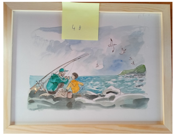
4B – 36x27 cm