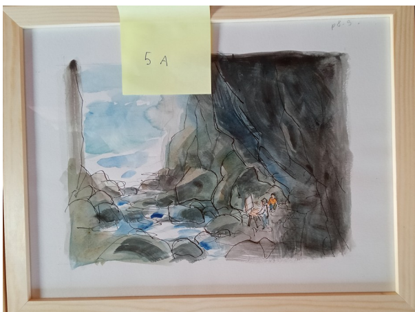
5A – 36x27 cm