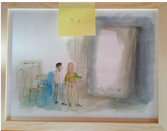
9A – 36x27 cm