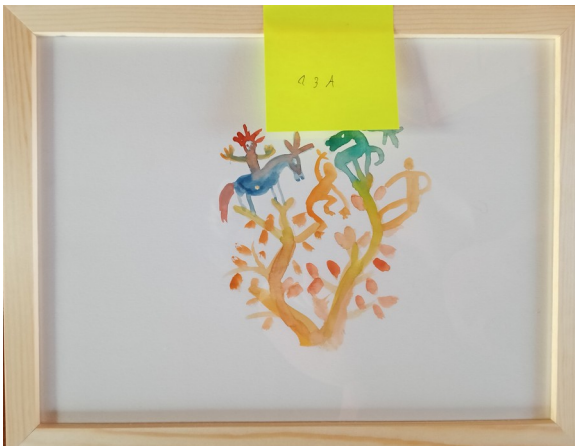
13A – 36x27 cm