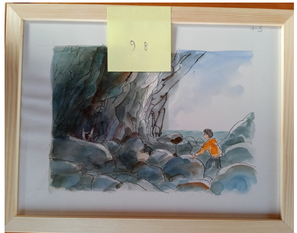
9B – 36x27 cm