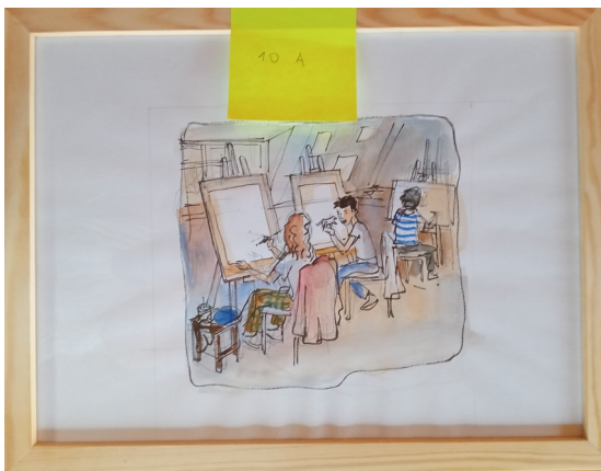
10A – 29x37 cm