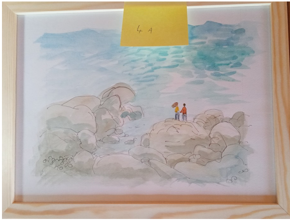
4A – 36x27 cm