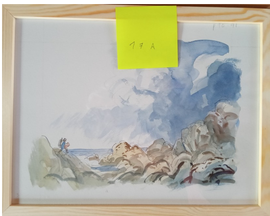
17A – 36x27 cm