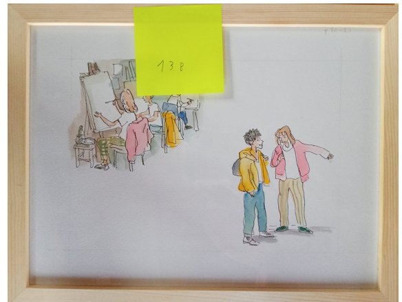
13B – 36x27 cm