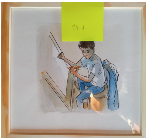
14A – 28x27 cm