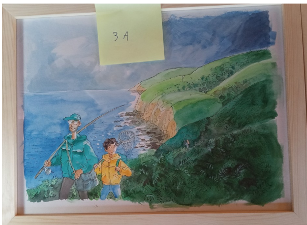
3A – 36x27 cm