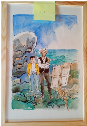
8A – 45x31 cm