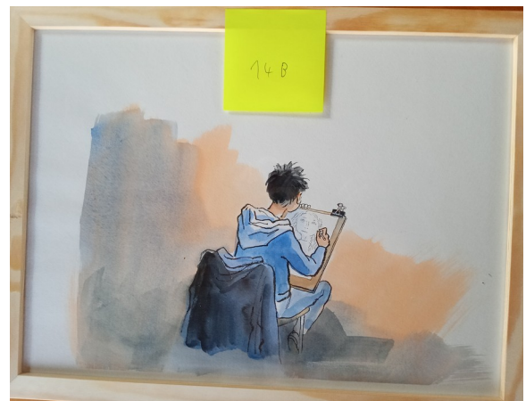
14B – 31x31 cm