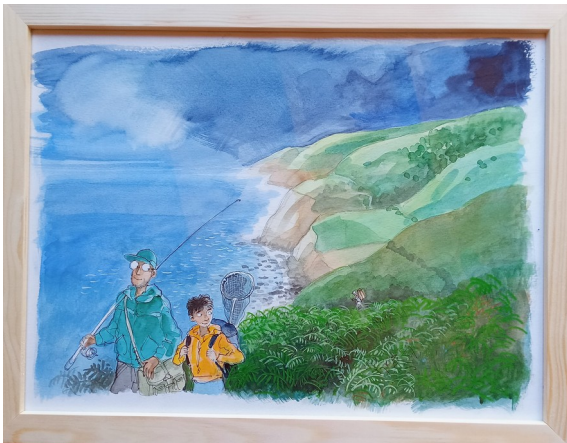
1A – 36x27 cm