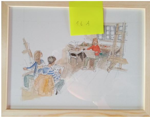
16A – 36x27 cm