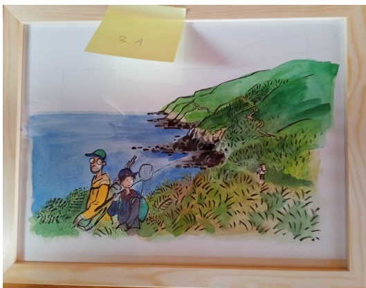
2A – 36x27 cm