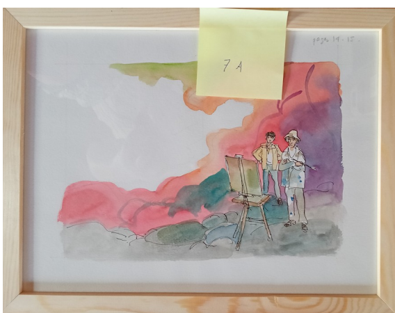
7A – 36x27 cm