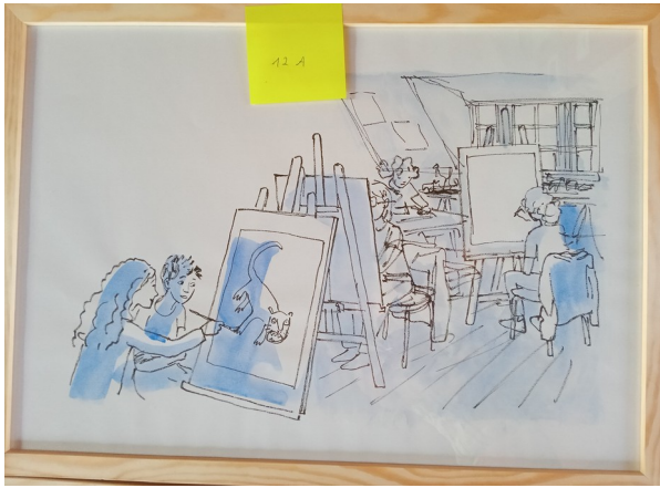
12A – 53x38 cm