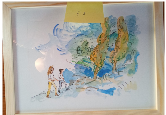
5B – 36x27 cm