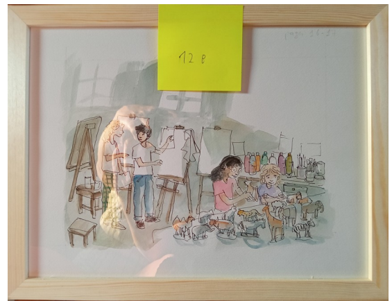
12B – 36x27 cm