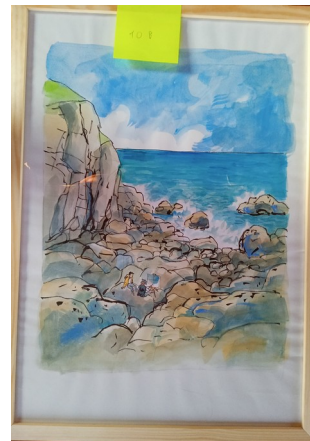
10B – 53x38 cm