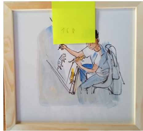
16B – 25x26 cm