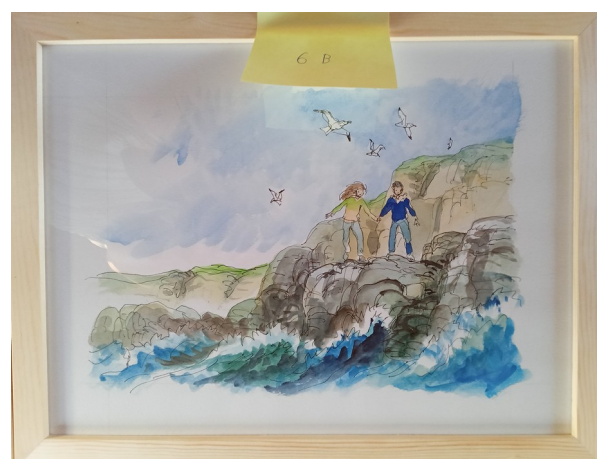
6B – 36x27 cm