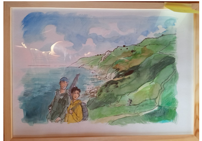
1B – 53x38 cm