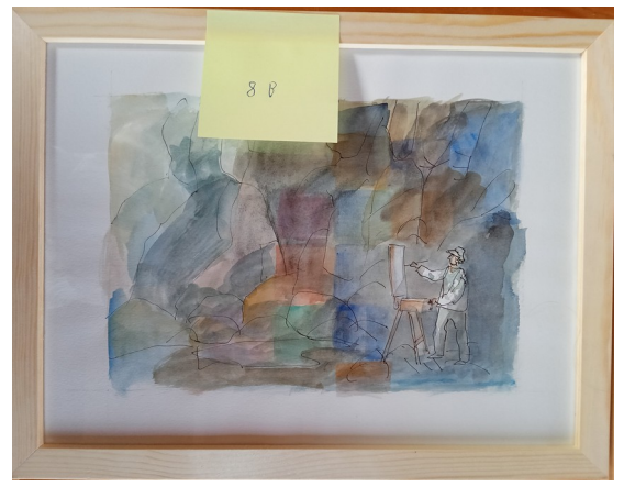
8B – 36x27 cm