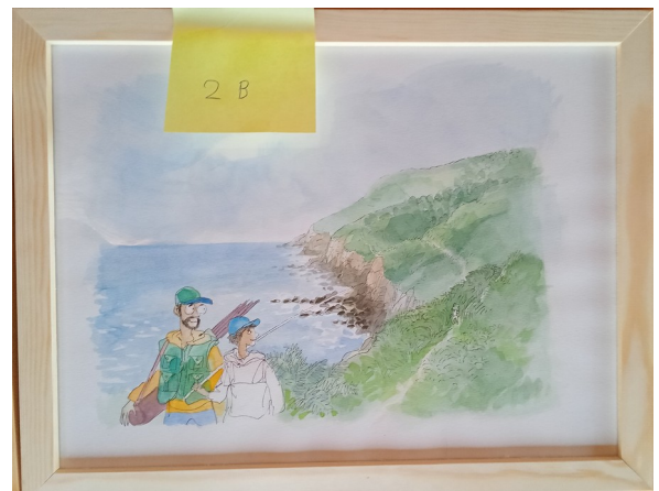
2B – 36x27 cm