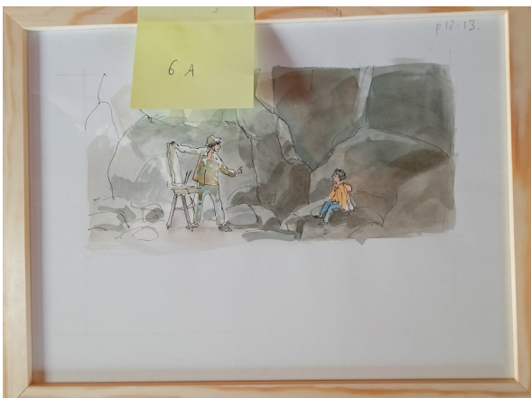
6A – 36x27 cm