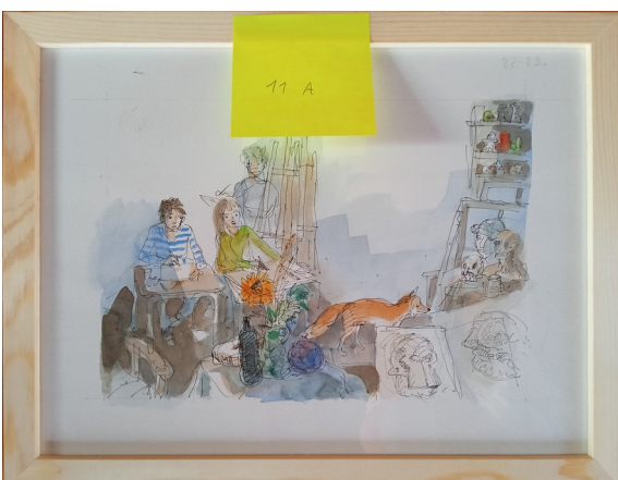
11A – 36x27 cm